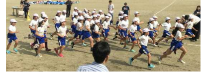
主なスタートの様子