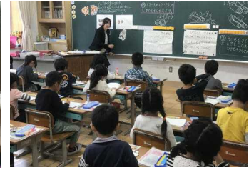
1年2組 算数科 ひきざん