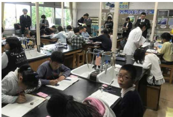
4年2組 理科 水の姿と温度