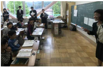
2年1組 算数科 かけ算