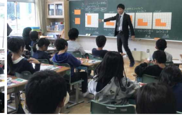
4年1組 算数科 面積