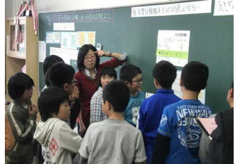
5年2組 算数科 単位量