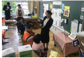
杉の子2組 生活単元学習

先生方の授業力の向上が、子どもたちの学力向上につながると考え、さらに研鑽を積み重ねて参ります。