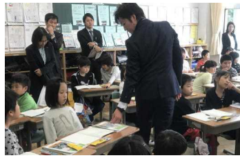
3年1組 算数科 小数