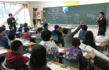
6年1組 算数科 速さ