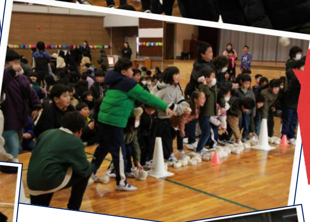
チェッコリ玉入れ