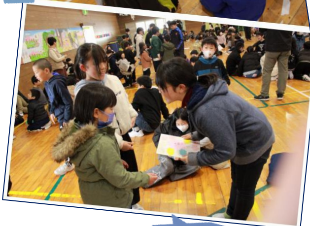
色紙のプレゼント